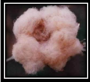
صورة (١) قطن ملون طبيعيا

إتجهت بعض شركات الملابس التي تستخدم عدة أساليب للتصميم البيئي من أجل تغيير مستقبل صناعة الغزل والنسيج لتكون صديقة للبيئة بشكل أكبر، حيث تقوم بإعادة تدوير الملابس المستعملة لتقليل استخدام الموارد، وذلك باستخدام مواد نسيجية قابلة للتحلل الحيوي للحد من تأثيرها على البيئة واستخدام الأصباغ النباتية بدلاً من المواد الكيميائية السامة لتحسين مظهر النسيج. (٥) استحداث بعض أنواع من القطن الملون طبيعياً إن القطن الملون تتم زراعته بتقنيات حيوية مثل التهجين والتعديل الوراثي ويكون أحمر أو أصفر أو أخضر أو أسمر. ويمكن غزل ونسج هذا القطن لإنتاج ملابس بدون عملية الصباغة المعقدة لتخفيض تكاليف الإنتاج وتقليل أضرار المواد الكيماوية على أجسام البشر (٦)، لذلك هو منتج حقيقي صديق للبيئة كما في الصورة (١)