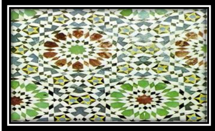
صورة (٤) تصور فسيفساء على جدران المساجد

وقد لاحظ كثير من الباحثين وجود نسب حسابية ثابتة تتكرر في الكون ومنها النسب الميتافيزيقية والتي أطلق عليها النسبة الذهبية، وهناك عدد من الباحثين الذين حاولوا وضع هذه الأسس في إطارات مختلفة ومن هذه المنظومات المدخل المتكامل للآليات التي تحقق