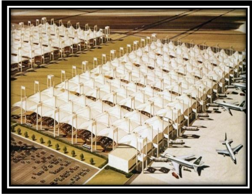
صورة (٢) مطار الملك عبد العزيز

اما في حالة إعادة تدوير المنسوجات فقد تم الاستفادة بها في كثير من الصناعات مثل صناعة السيارات حيث استخدمت المنتجات غير المنسوجة في عزل الحرارة و عزل الصوت لتبطين موتور السيارة و الابواب و استخدمت هذه المنتجات في تبطين الابنية لعزل الحرارة و الصوت و بالتالي التقليل من استهلاك الطاقة المستخدمة في أجهزة التكييف او أجهزة التدفئة في البنايات .