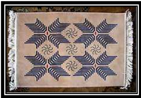
صورة (٥) سجادة مطبوع عليها بصمات حيوية

و يمكن تعريف البصمات الحيوية بأنها عبارة عن رسومات خطية مجردة، ترمز كل واحدة منها إلى عضو معين بجسم الإنسان وكل منها له طاقة نوعية خاصة تدخل في رنين مع العضو الذي تمثله ولأنها متزنة فإنها تحدث اتزان في ذلك العضو لم تصمم أشكال الهندسة الحيوية بهدف العلاج ولكنها تعمل على جميع المستويات لتوازن مجالات الطاقة بالجسم، وبالتالي تساهم في سرعة العلاج وتختلف الاستجابة للعلاج من شخص لآخر (٨) .